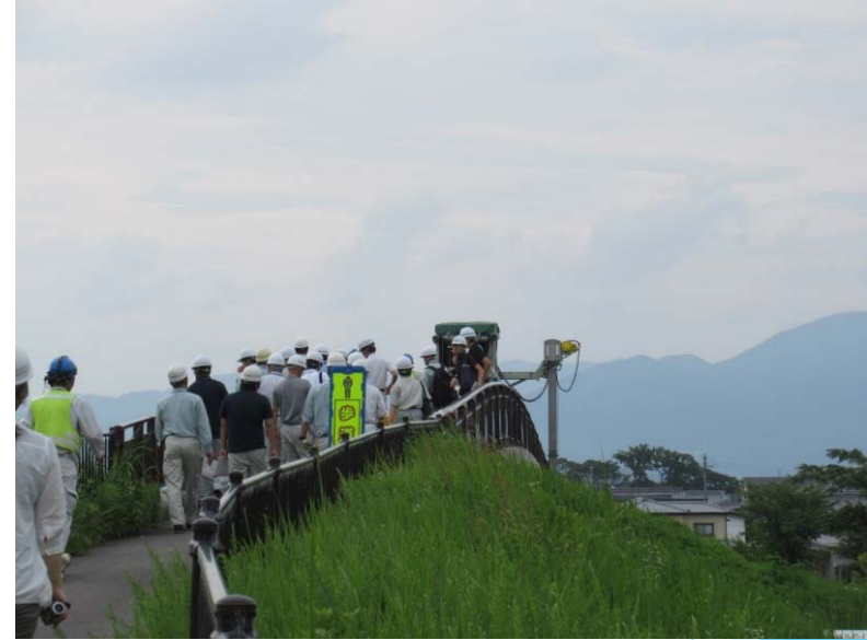
桁下から橋面に大移動中