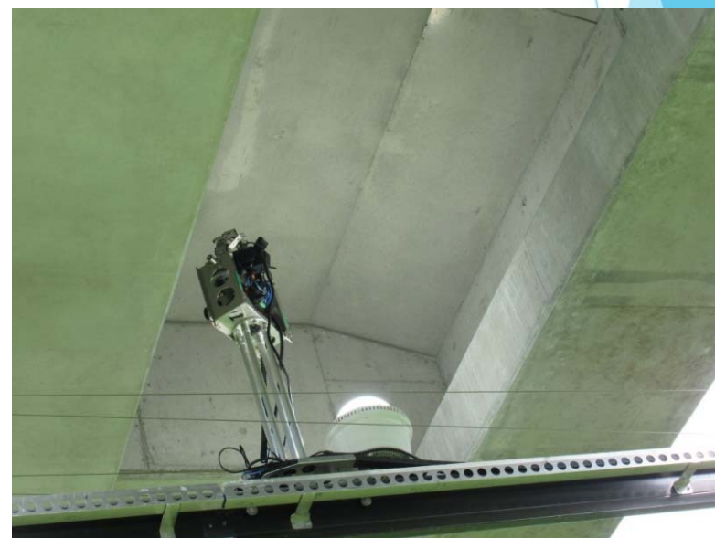
明るさ確保！LED照明スイッチON 明るい、よく見えます