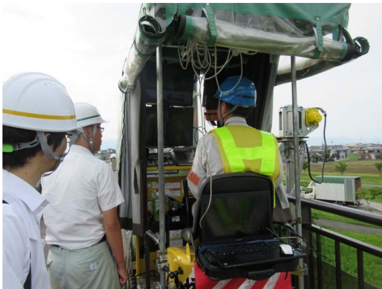
見つめられて当社のオペレーター緊張中