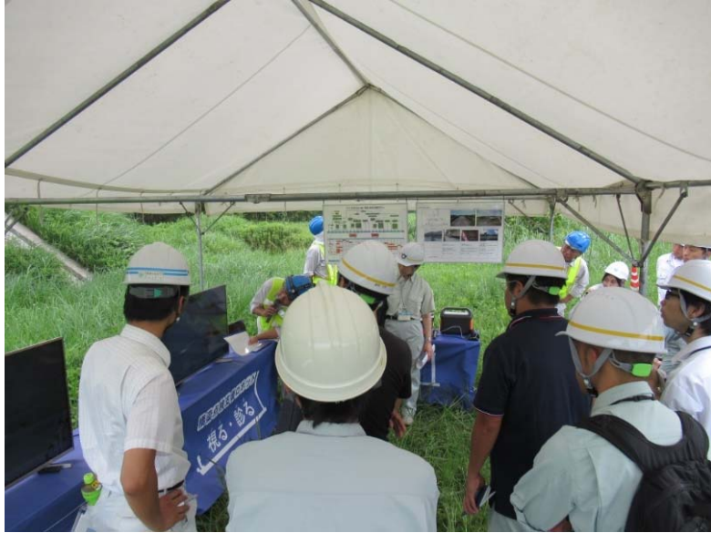
点検画像を配信して確認中 受講者は遠隔診断の模擬体験中