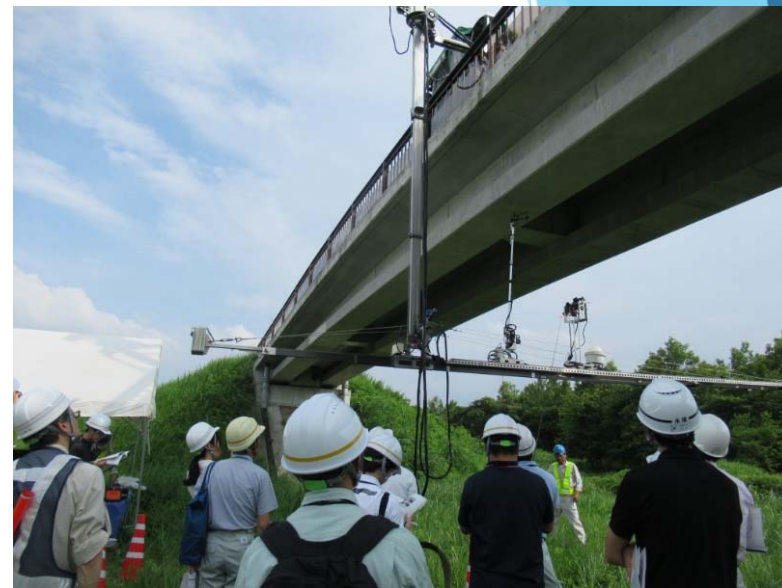
主桁下面を打診点検中 打診音は専用マイクで集音して操作台車内で確認します