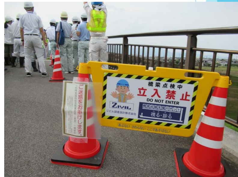
NEW看板も福井を飛び出し滋賀で活躍中！ 次はどこに行くのかな？