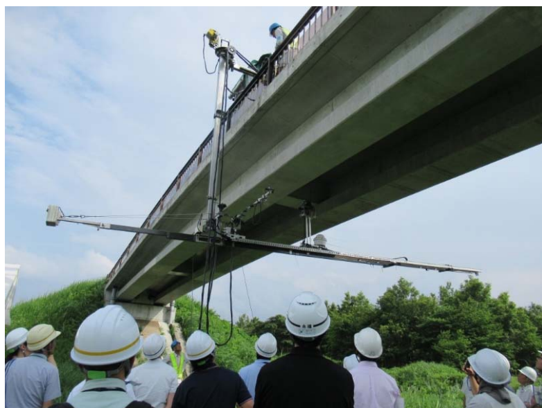
主桁の打診点検に引き続き、主桁の点検中 桁間が暗くてよく見えません