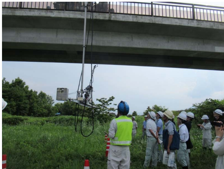
橋梁桁下でロボット動作説明中